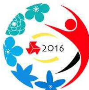
2016 情熱疾走 中国総体